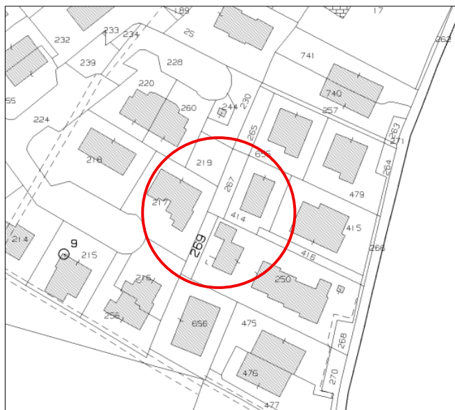
Estratto di mappa catastale