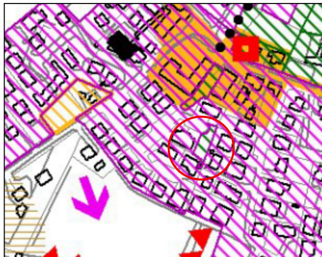
Estratto del P.A.T. approvato Tavola A4 – carta della Trasformabilità