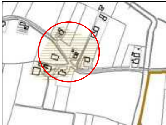
Estratto del P.A.T. approvato Tavola A4 – carta della Trasformabilità