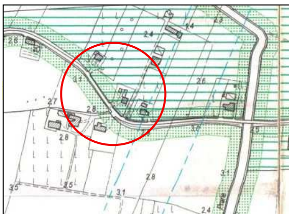
Estratto del vigente P.R.G. Tavola 13.3.b Arzercavalli Zone Significative