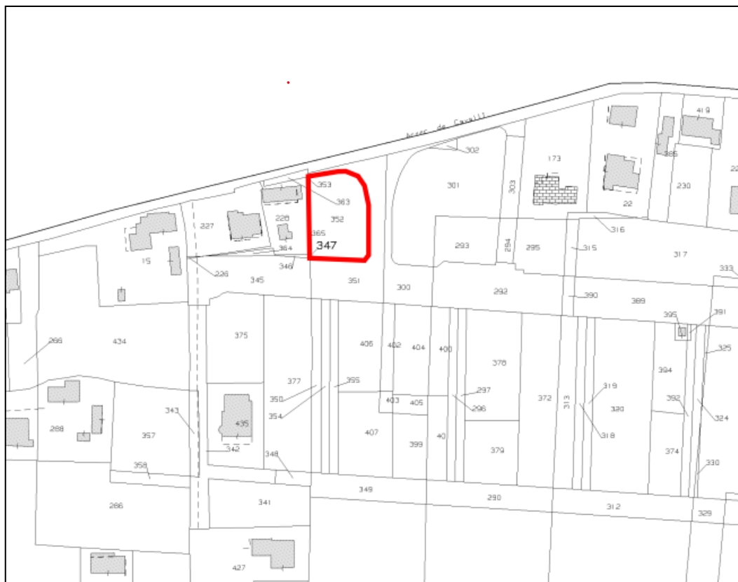
Estratto di mappa catastale