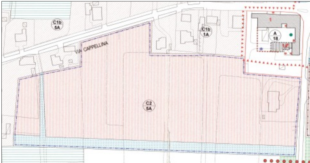
Estratto del vigente P.R.G. Tavola 13.3.b Arzercavalli Zone Significative